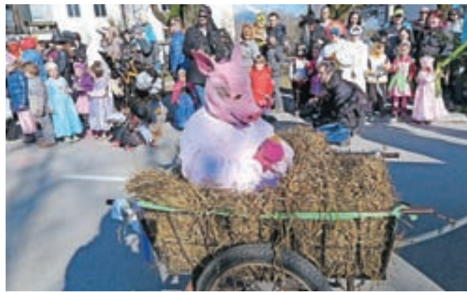
Tradicionalni pustni sprevod (na fotografiji utrinek z lanskega) se bo pred stavbo nekdanjega Merkurja v Radovljici začel jutri ob dveh popoldne.

Jutri popoldne se pred stavbo nekdanjega Merkurja pri semaforiziranem križišču začne tradicionalna pustna povorka, v torek popoldne pa bodo v Begunjah po dvanajstih letih spet vlekli ploh.