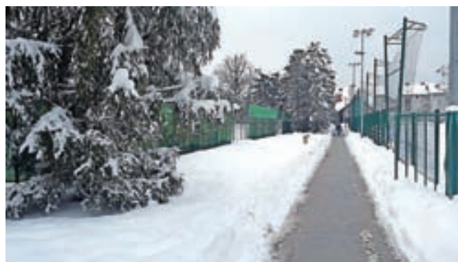
Spomladi bodo na mestu posekanih smrek posadili nova drevesa.

Vzdolž teniškega igrišča, ob peš poti mimo športnega parka v Radovljici, so jeseni posekali dvanajst smrek in dva listavca. Kot pojasnjujejo na občinski upravi, je bilo drevje treba posekati, ker so bile nekatere smreke suhe, nekatere pa je napadel lubadar. "Ostalim smrekam je Komunala Radovljica skrajšala vrhove in veje, ker so se preveč razrasle. Spomladi bodo na mestu posekanih smrek posajena nova drevesa. Posek je bil izveden z dovoljenjem občinske uprave na podlagi terenskega oglada in strokovnega mnenja Zavoda za gozdove Slovenije – Območne enote Bled," so pojasnili na občinski upravi.