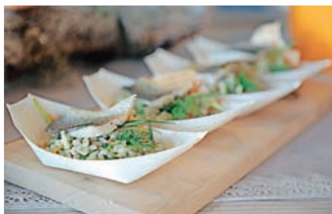
Teorija in praksa hodita z roko v roki; pokušina nekaterih receptov je bila slastna in prepričljiva.

živilske tehnologije. V njej so predlogi – recepti menijev s hladno in toplo predjedjo, glavno jedjo in sladico, upoštevajoč tradicijo, letne čase, iznajdljivost in fantazijo posamičnih chefov. Seveda knjiga ni namenjena le diabetikom, ampak vsem, ki radi dobro in zdravo jedo po načelih redno – zmerno – sveže – pestro, za osebe z diabetesom pa še prešteto. Na predstavitvi knjige Najboljše z vrha so se vsi lahko prepričali, da hodita teorija in praksa z roko v roki, pokušina nekaterih receptov je bila slastna in prepričljiva. Živahno vzdušje izmenjave mnenj in izkušenj je vladalo med »kulinaričnim plemstvom«, kakor je bilo slišati v šali.