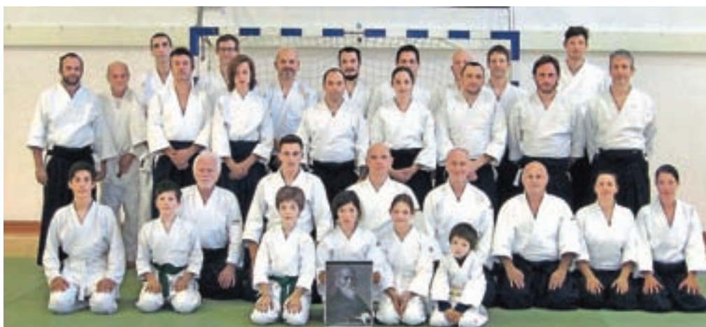
Udeleženci desete zimske šole aikida v Planici

V aikidu ni tekmovanj, kar je za nekatere prav glavni razlog, da se priključijo. Nič drugače ni bilo na tečaju, kjer so udeleženci imeli izpit. Treba je bilo pokazati določene tehnike in tehnična znanja, ki so potrebna za pridobitev določenih rangov.