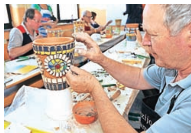
Ustvarjanje mozaika na prvem študijskem krožku Moderni mozaik

"Človek v prvi vrsti potrebuje dobro in trdno socialno mrežo ... še bolj pa potrebuje prebuditve ustvarjalne energije, ki domuje v vsakem izmed nas. Prav vsak človek je ustvarjalen ... prav vsak! Pomembno je, da tečajnika pripeljemo do te stopnje, da najde sam svoj notranji ustvarjalni glas. In ko ga najde, ko to ustvarjalno energijo tudi manifestira v izdelek, to prinese osebno zadovoljstvo. Ustvarjanje